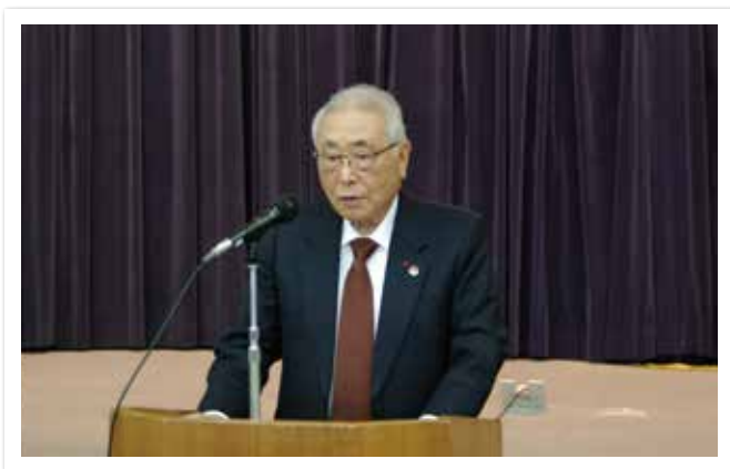
相原会長のあいさつ

令和6年3月25日、神奈川県警察本部大会議室に県内54の地域暴力団排除組織役員等が集い、令和5年度総会が開催されました。会長と刑事部長のあいさつにはじまり、役員の変更、令和6年度の活動方針（広報啓発活動の強化と身近な機関、団体等との連携）が議決され、暴力団のいない住みよい地域社会を実現するとの決意を新たにしました。