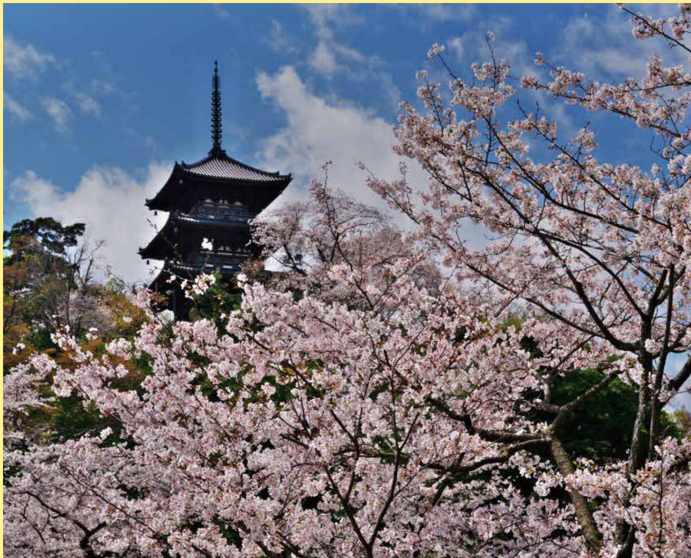
横浜三溪園